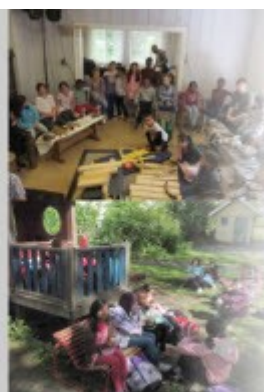
Når skal vår skole på besøk? Spilleplanen for hele perioden ligger på drivhuset.org

Mølla Skrammelan - hva er det? 2. og 3. trinn fra Oslo-skolene besøker Biermannsgården i april og mai 2011. Her er det dekket opp med gonger og skrammelrommer, lydveiver, patenbasser, syntner og samplere, jafflplater og enda mer. Sammen med to av Drivhusets musikere lager elevene nye komposisjoner som ofte er vore knyttet opp til Sagene historie og fabrikkens lange Akaselia. Betegnelsen "Skrammelan" er et endopill rundt isonessisk Gammel-ordster som for en stor del består av metallinstrumenter. Siden mange av instrumentene er gjort på leppemaloid og kan betegnes som skrammel gir navnet seg selv.